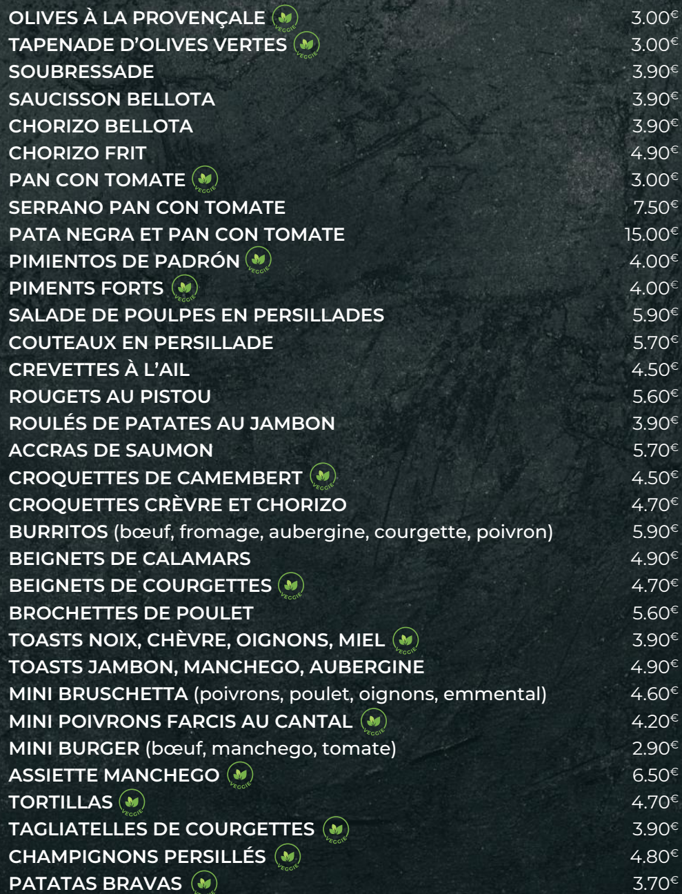
PLANCHE DE CHARCUTERIE & FROMAGE 18.00€

Serrano, saucisson & chorizo bellota, chèvre, soubressade, jambon blanc à la truffe, manchego